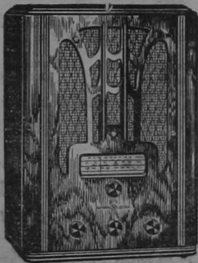
RADIO G. E. MODELO E-81

La rara belleza de sus muebles constituye la nota característica de la serie 1936-1937 de radios General Electric, debida al genio creador del propio estilista de la G. E., uno de los dibujantes industriales de más renombre en los Estados Unidos.