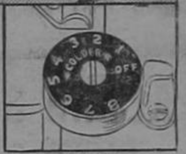
Temperature regulator speeds freezing