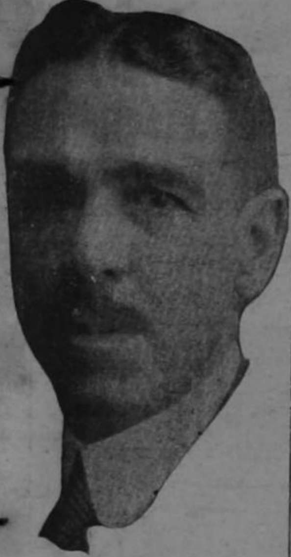
Lic. don Alfredo González Flores, fundador del Banco Internacional, y presidente de la junta directiva del Banco Nacional de Costa Rica.