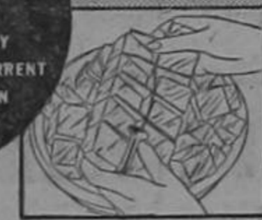
Plenty of ice cubes with Electrolux